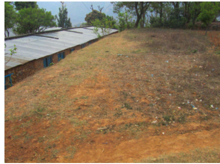
hier komen de twee klasjes

Tijdens mijn voorgaande twee verblijven in Nepal hebben we vergaderd over dit onderwerp. In februari a.s. kunnen zij deze twee klasjes gaan bouwen. Wij leveren het materiaal en maken het ontwerp van de klasjes. Zij zijn verantwoordelijk voor de uitvoering. Regelmatig zal ik gaan kijken hoe de bouw verloopt. Ons doel, Satrasaya en omgeving te ontwikkelen op een eenvoudige manier is bijna bereikt. Over ongeveer twee jaar kunnen zij het allemaal zelf. Spannend om dan te zien hoe het verder gaat.